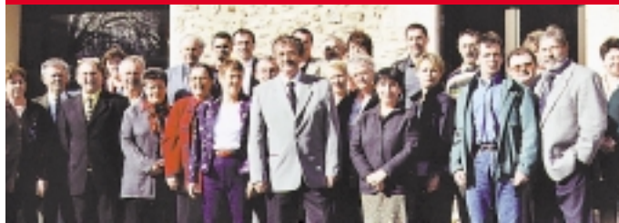
Pour mieux connaître vos élus : cinq nouveaux portraits après les 21 déjà présentés dans ces mêmes colonnes...