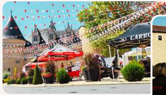
➤ Soli'Drive | Août 2025