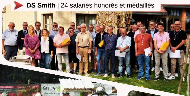
➤ DS Smith | 24 salariés honorés et médaillés