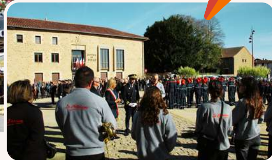
➤ Commémorations | 11 novembre