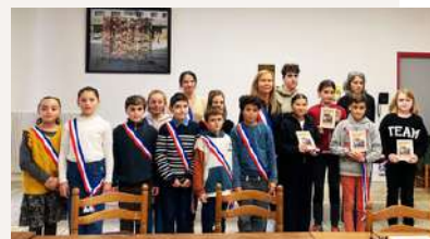
Photo de l'équipe sortante

À l'heure où nous écrivons ces lignes, les résultats ne sont en effet pas encore connus : les nouveaux élus seront présentés dans le prochain numéro du magazine.