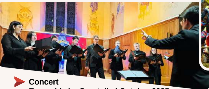
➤ Concert Ensemble La Sportelle | Octobre 2025 Avec Fondation Rocamadour, Fondation du Patrimoine et la Gerbe