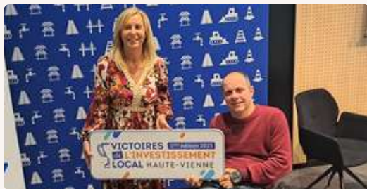
➤ Victoire de l'investissement local 2025 pour nos ruelles anciennes