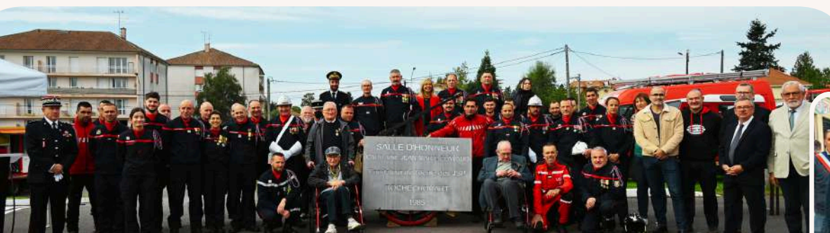
➤ 40e Anniversaire | Ecole des Jeunes Sapeurs-Pompiers (JSP) de Rochechouart