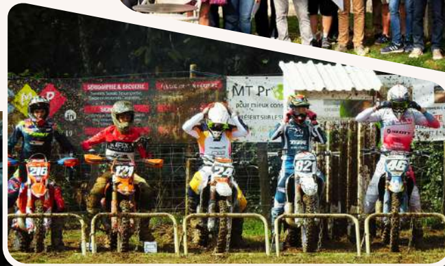
➤ Motocross Rochechouart 2025