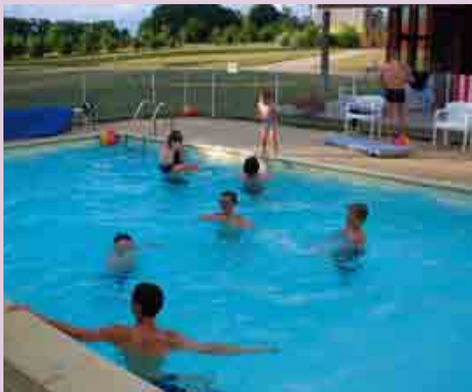
Piscine au hameau de gîtes de La Chassagne

Les capacités d'hébergements sur notre Communauté de communes se montent à environ 500 personnes pour une population de 5 380 habitants. Le choix ne manque donc pas, pour les touristes ou pour vos grandes occasions ! Pour tout renseignement, contactez l'Office de Tourisme (05 55 03 72 73). Le personnel vous accueillera au mieux, et pourra même vous accompagner pour visiter. Renseignements aussi sur internet ( rochechouart.com ) en attendant le site propre de l'OTSI.