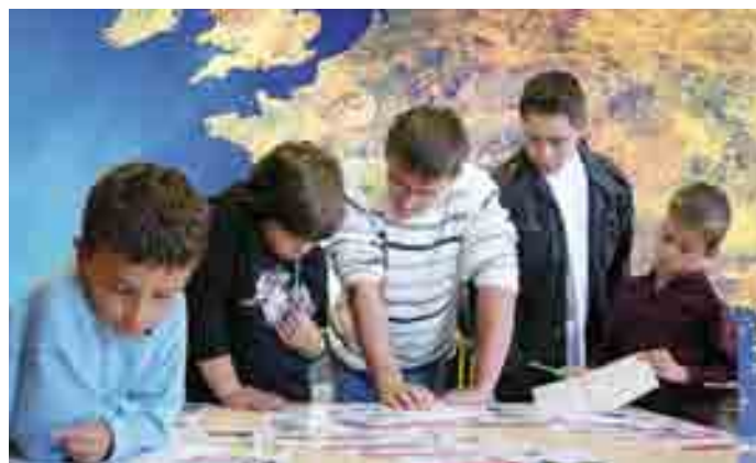
"À la découverte de l'Europe de manière ludique". Mieux comprendre l'Europe d'aujourd'hui permettra aux enfants de faire et de vivre l'Europe de demain !

A noter, le service animation apporte également un soutien très actif à la formation "qualifiante" des jeunes. Ainsi, depuis quatre ans, plusieurs brevets d'Etat d'animateur, un BEATEP, deux BPJEPS ont été validés. Cette année, trois "DESO" dans le cadre du Bac pro. "Service à la personne" sont en cours d'obtention. Ces stagiaires contribuent aussi à la vitalité du dispositif d'accueil. Un grand Bravo à tous pour le travail accompli !