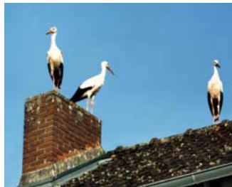
« Chabatzt d'entrar ! »

Assurément les Rochechouartais aiment et savent accueillir. D'ailleurs les cigognes annonciatrices d'heureux événements n'ont pas manqué de faire étape chez nous avant de partir vers leurs quartiers d'hiver !