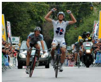
image très positive de notre région. Ce fut un énorme succès populaire pour l'arrivée de la 3 ème étape le jeudi 23 août et le départ de la 4 ème étape le vendredi 24 août.

La Municipalité de Rochechouart et la Communauté de Communes du Pays de la Météorite se sont confrontées à une grosse organisation pour cette épreuve cycliste internationale avec des partenaires qui exportent une