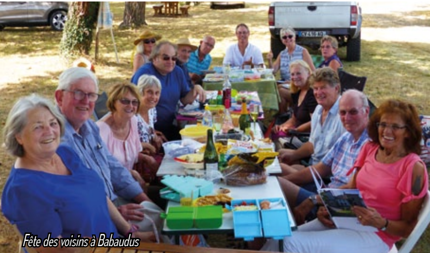
Fête des voisins à Babaudus