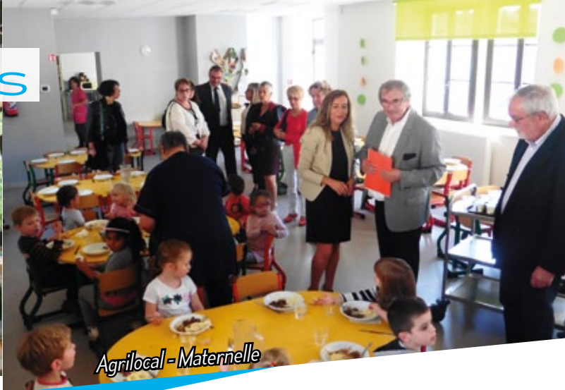
Agrilocal - Maternelle