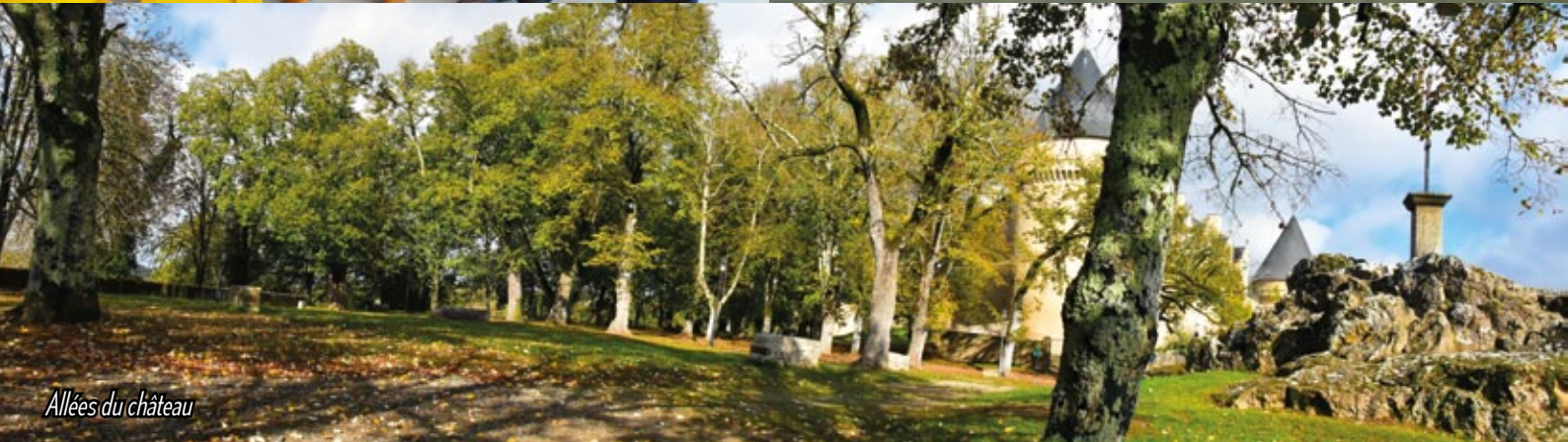
Allées du château