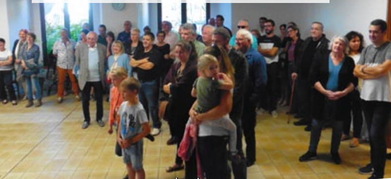
Accueil des nouveaux arrivants