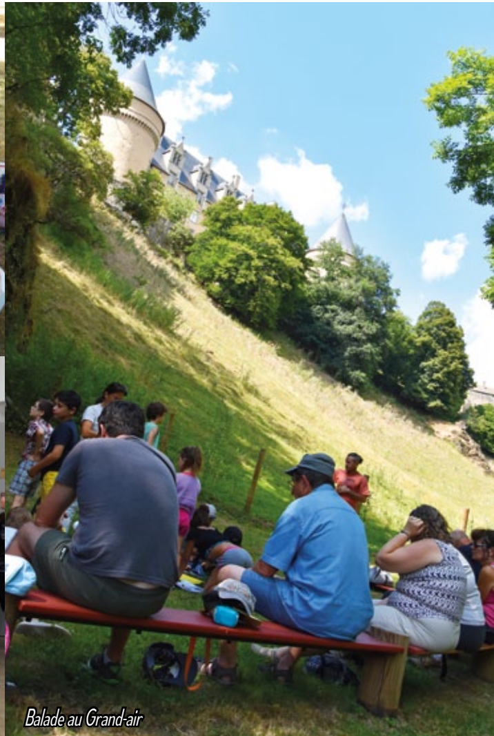
Balade au Grand-air