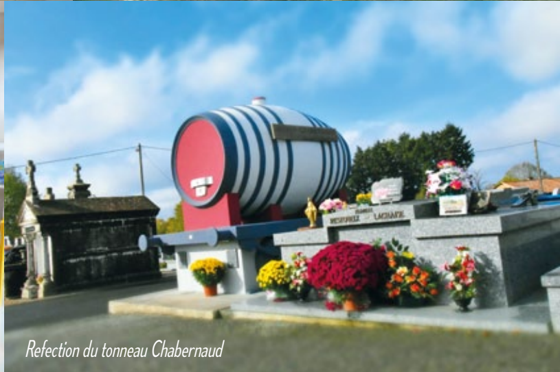
Refection du tonneau Chabernaud