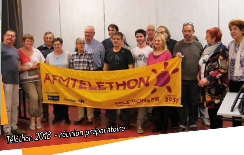
Téléthon 2018 - réunion préparatoire