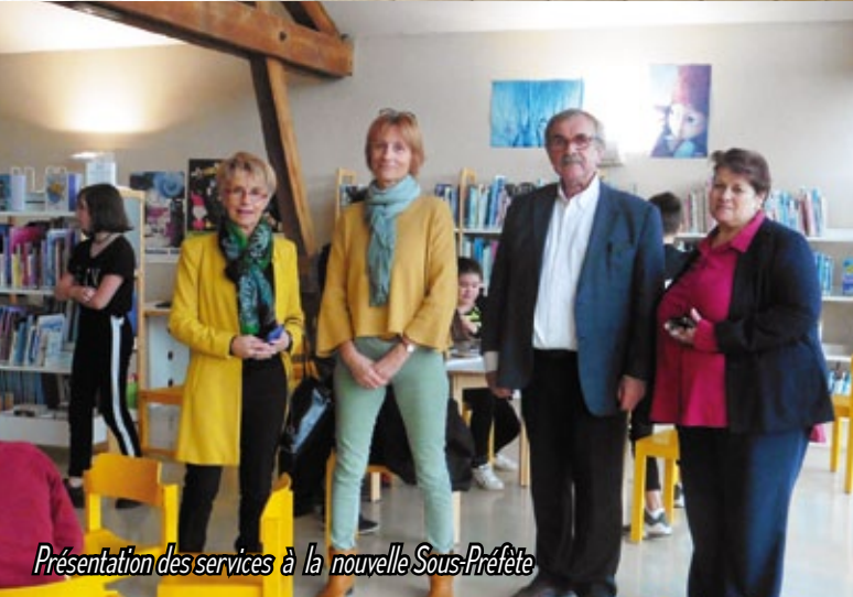
Présentation des services à la nouvelle Sous-Préfète