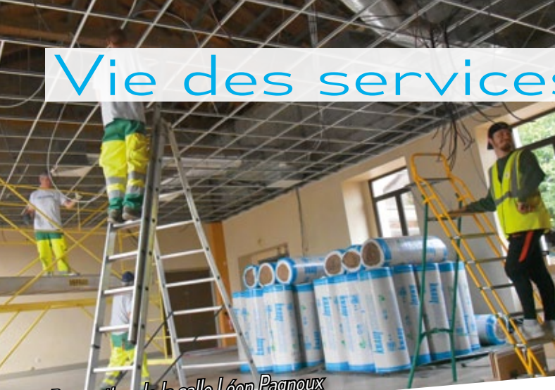
Rénovation de la salle Léon Pagnoux