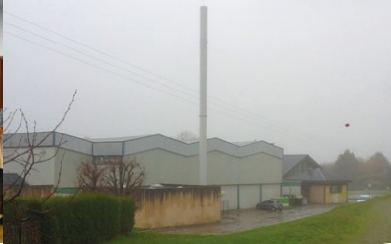
Nouvelle antenne Orange