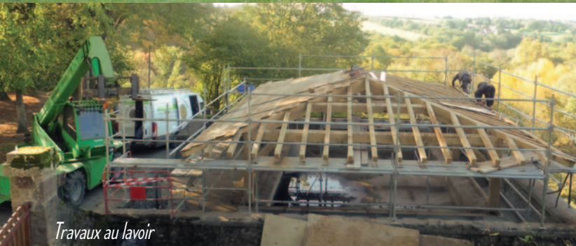
Travaux au lavoir