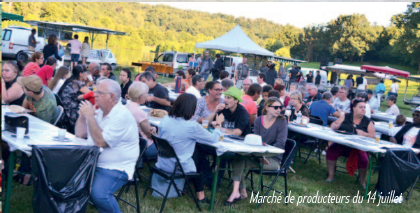
Marché de producteurs du 14 juillet