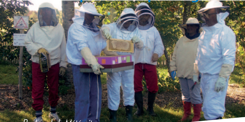
Rucher de la Météorite