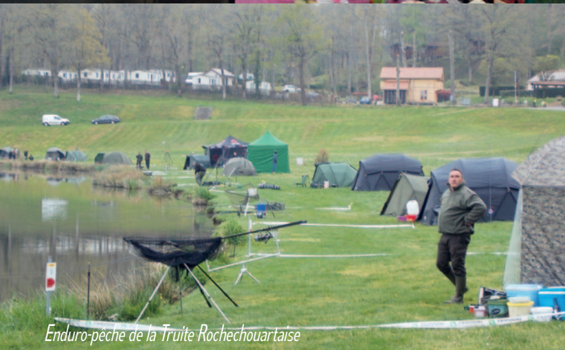
Enduro-pêche de la Truite Rochechouartaise