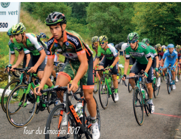
Tour du Limousin 2017