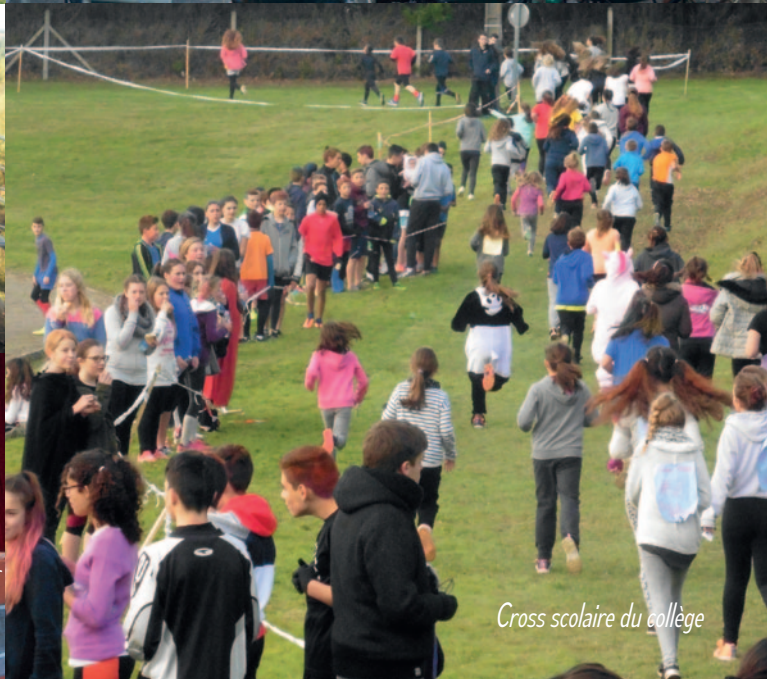
Cross scolaire du collège