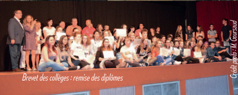
Brevet des collèges : remise des diplômes