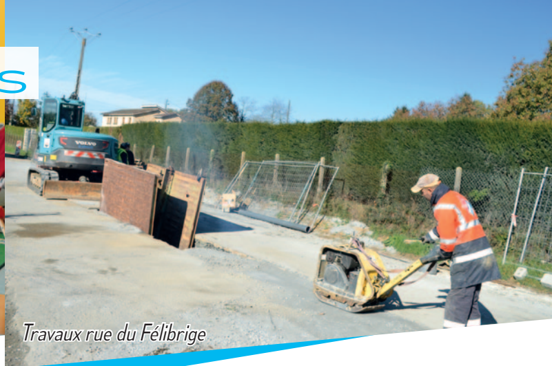
Travaux rue du Félibrige