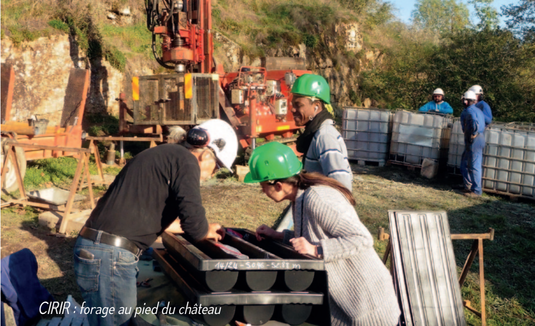
CIRIR : forage au pied du château

qualité est aussi au rendez-vous : « l'analyse de notre première récolte est très satisfaisante et les pollens dominants (châtaigniers, ronces entre autres) signalent un miel de forêt ».