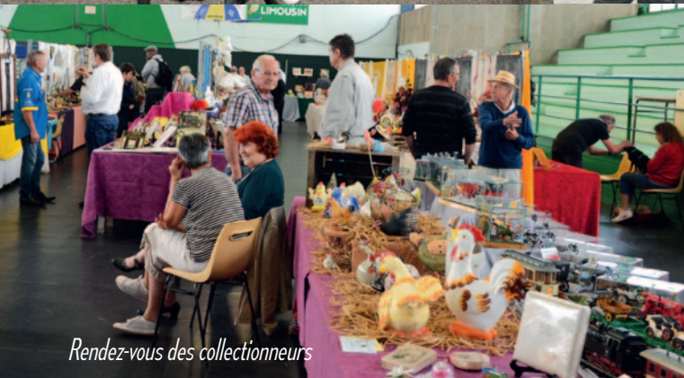
Rendez-vous des collectionneurs