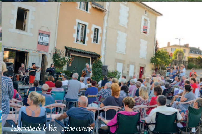
Labyrinthe de la Voix - scène ouverte