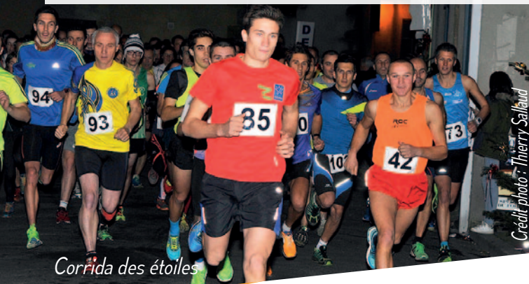
Corrida des étoiles