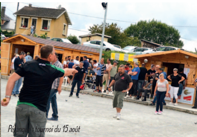
Pétanque : tournoi du 15 août