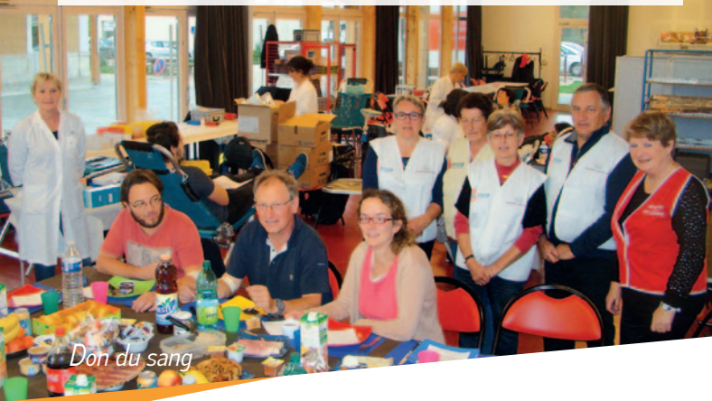
Don du sang