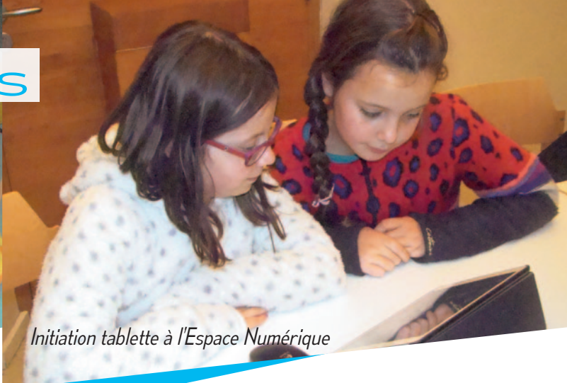
Initiation tablette à l'Espace Numérique