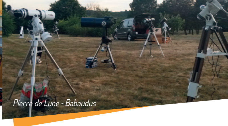
Pierre de Lune - Babaudus

DON DU SANG : une équipe renforcée L'Association des Donneurs de Sang Bénévoles du Pays de la Météorite poursuit avec énergie et dévouement sa mission, qui consiste à accompagner, 5 fois par an, les séances de collecte organisées par l'Établissement Français du Sang.