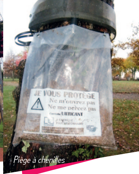
Piège à chenilles