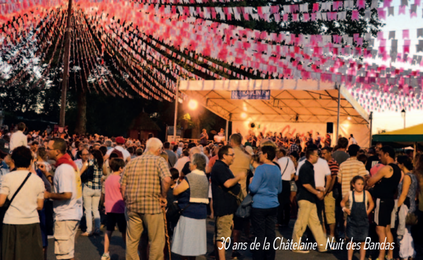
30 ans de la Châtelaine - Nuit des Bandas