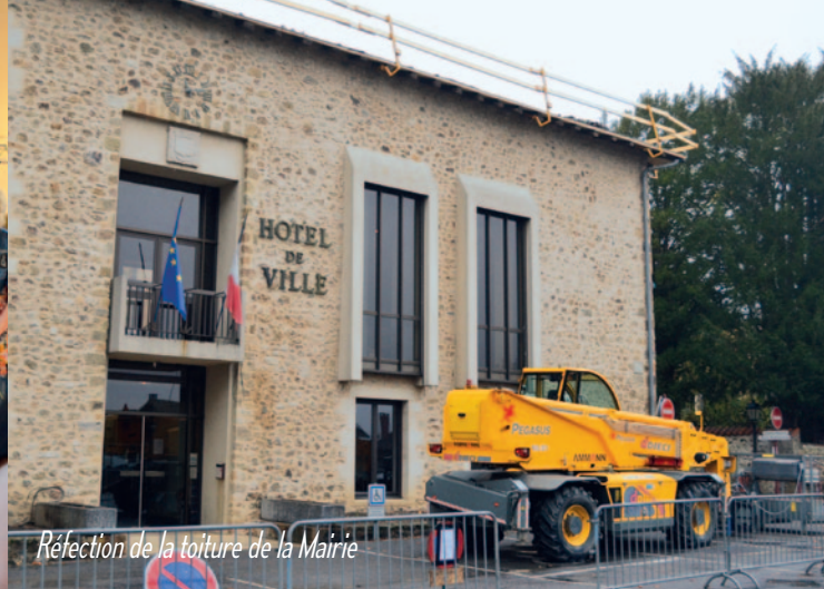
Réfection de la toiture de la Mairie