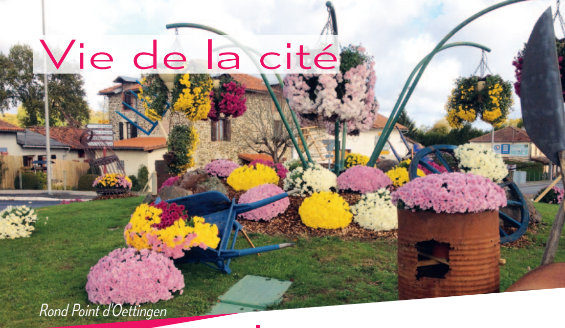
Rond Point d'Oettingen