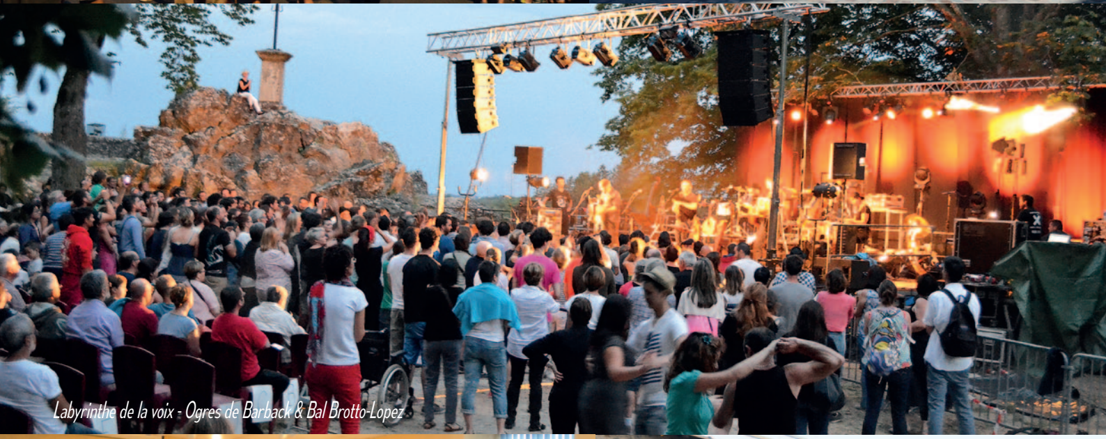
Labyrinthe de la voix - Ogres de Barback & Bal Brotto-Lopez