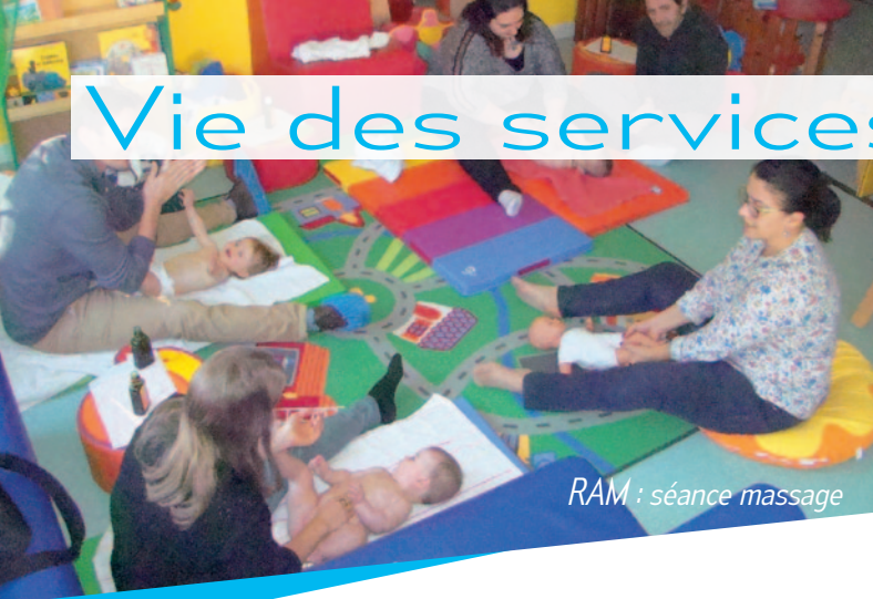
RAM : séance massage