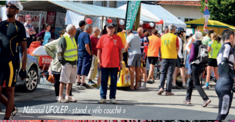
National UFOLEP - stand « vélo couché »