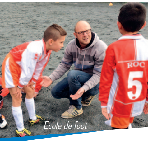
Ecole de foot