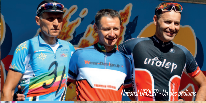
National UFOLEP - Un des podiums