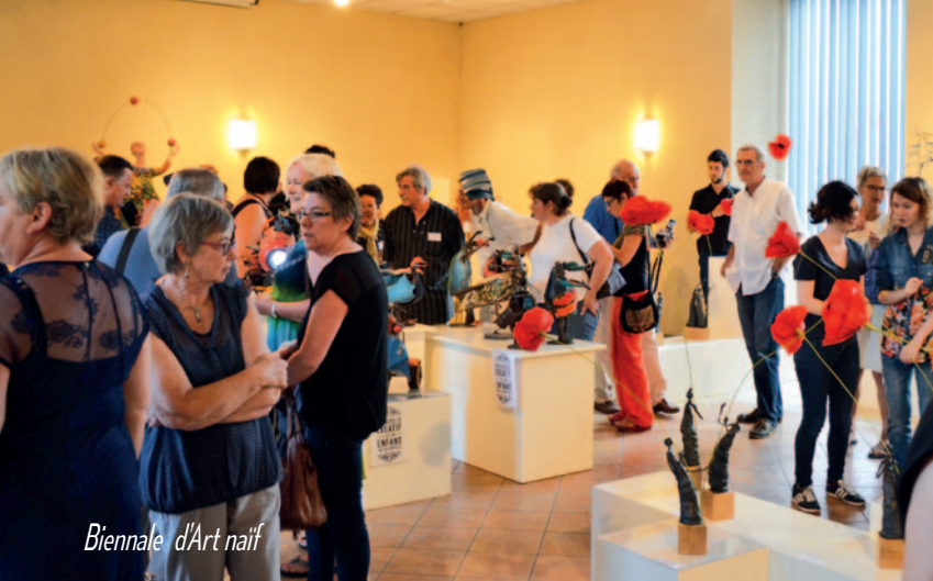
Biennale d'Art naïf