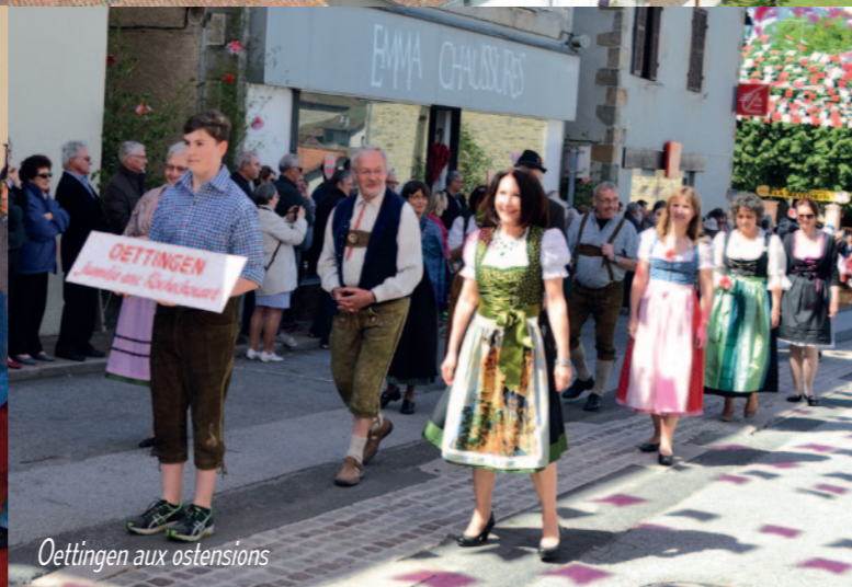
Oettingen aux ostensions