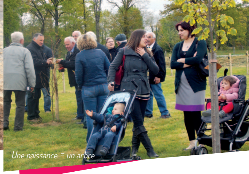
Une naissance = un arbre