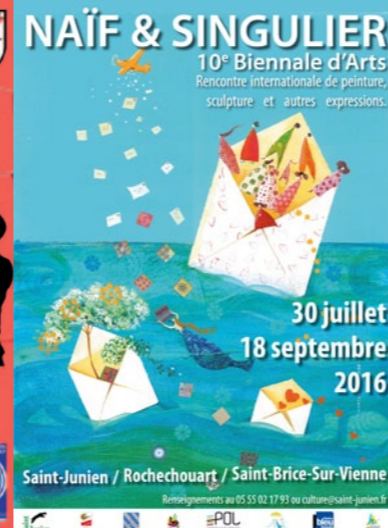
Biennale d'Art Naïf