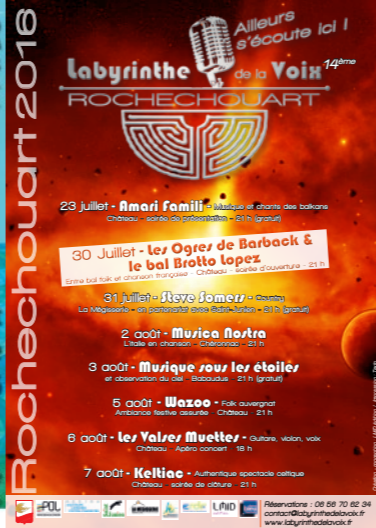
Labyrinthe de la Voix - 14e édition