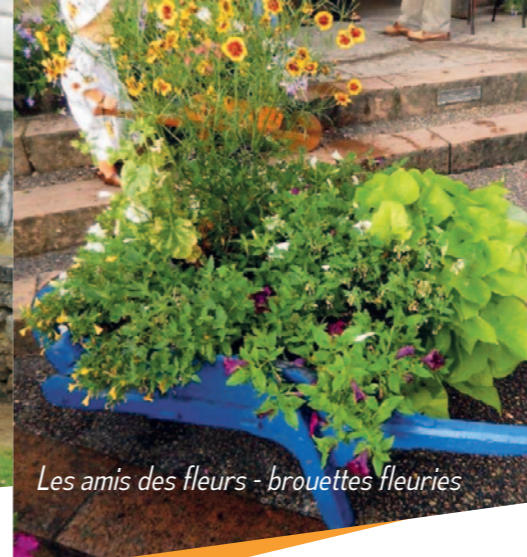
Les amis des fleurs - brouettes fleuries