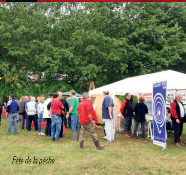
Fête de la pêche