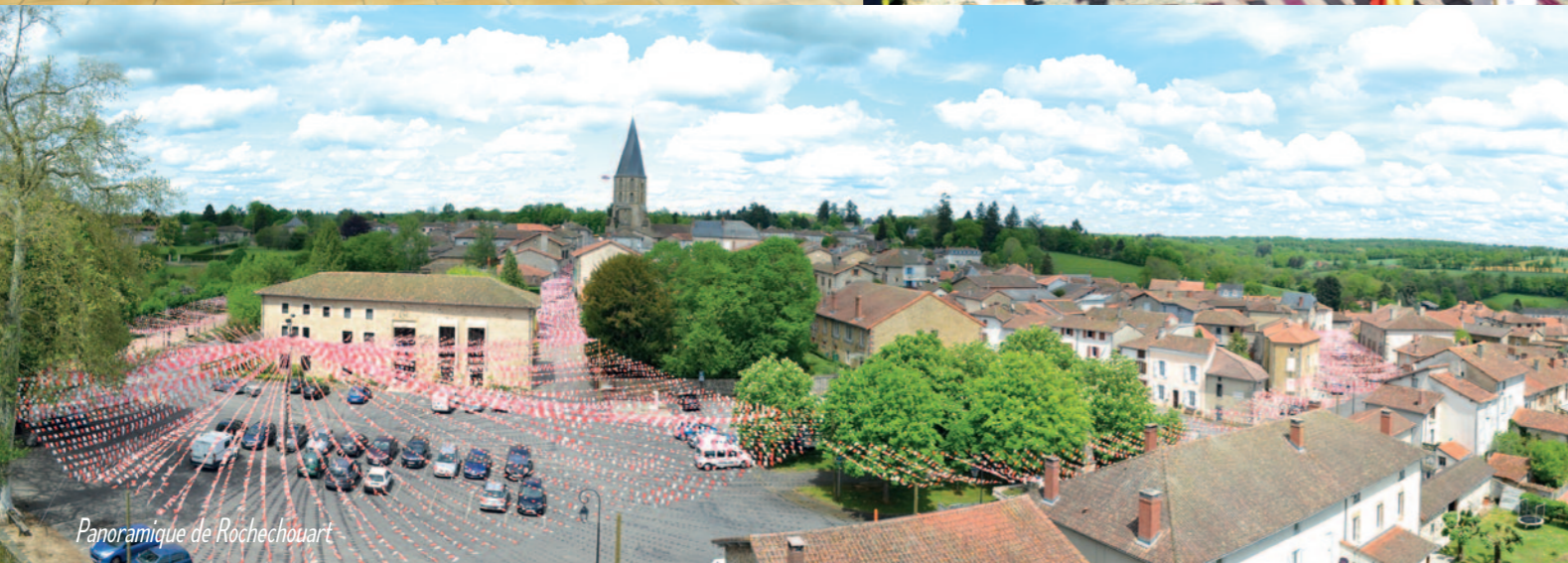
Panoramique de Rochechouart