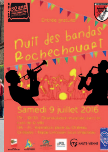
La Nuit des Bandas