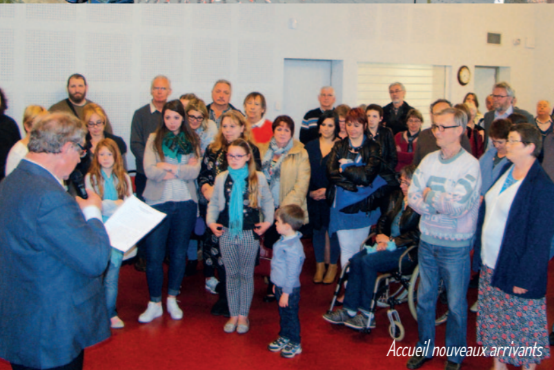
Accueil nouveaux arrivants