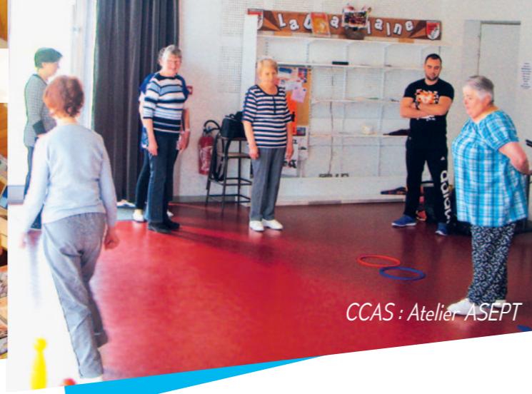
CCAS : Atelier ASEPT