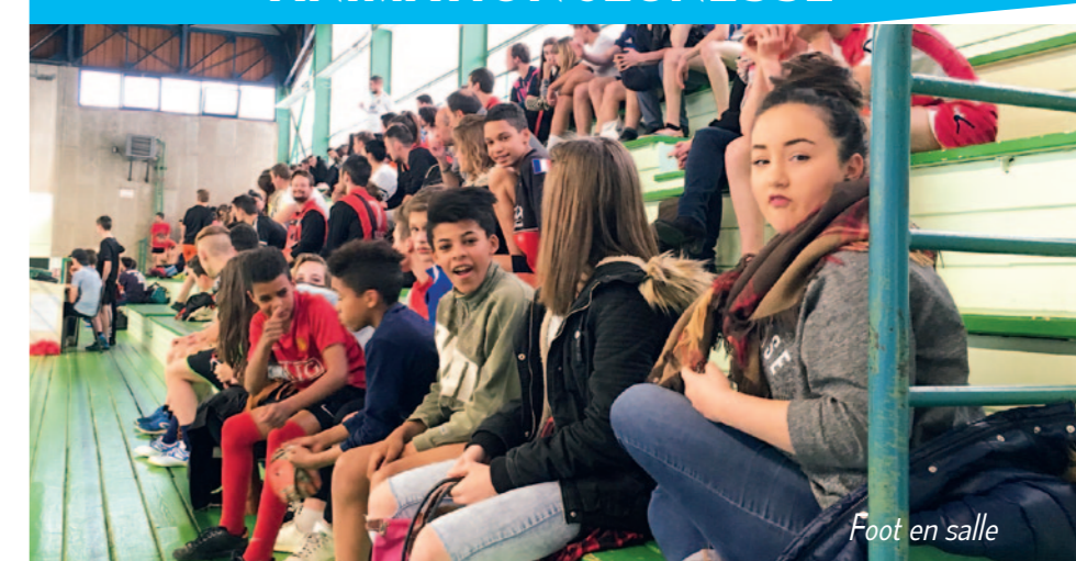
Foot en salle