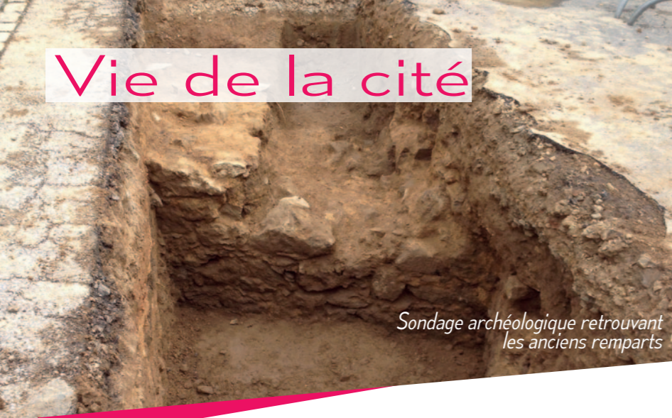
Sondage archéologique retrouvant les anciens remparts