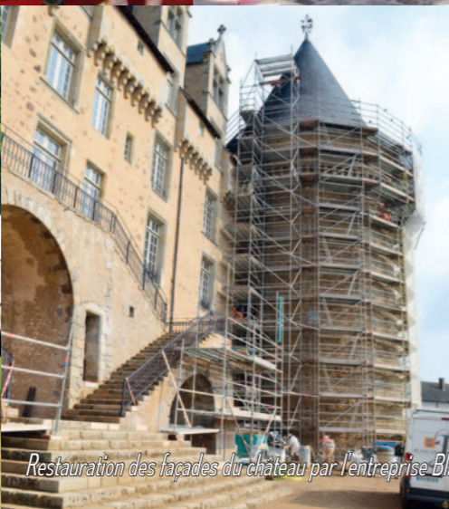
Restauration des façades du château par l'entreprise Blanchon