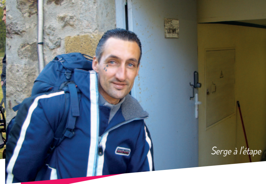
Serge à l'étape