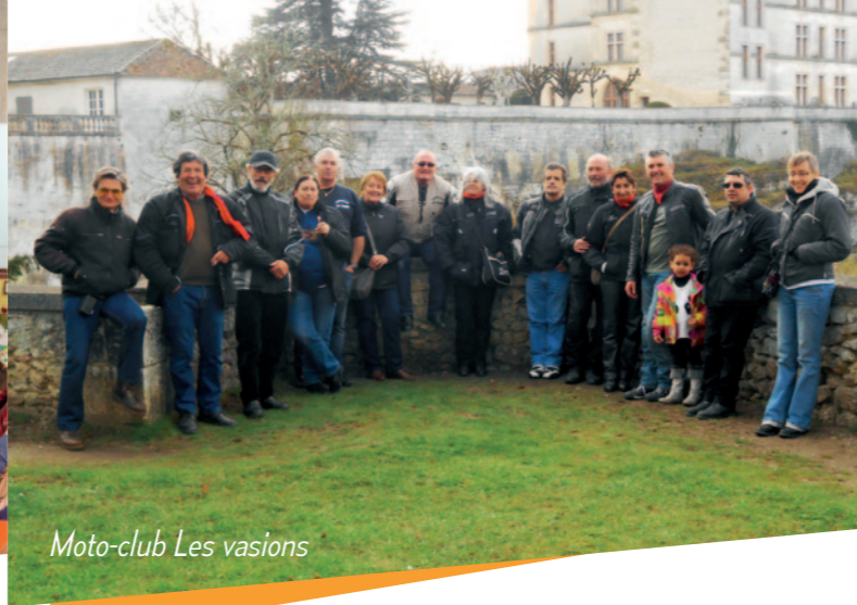
Moto-club Les vasions