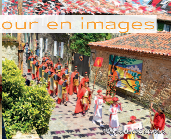
Défilé populaire des ostensions