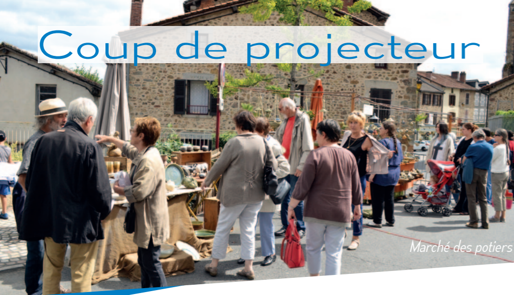
Marché des potiers