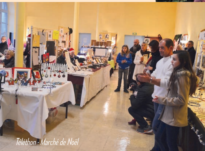
Téléthon - Marché de Noël