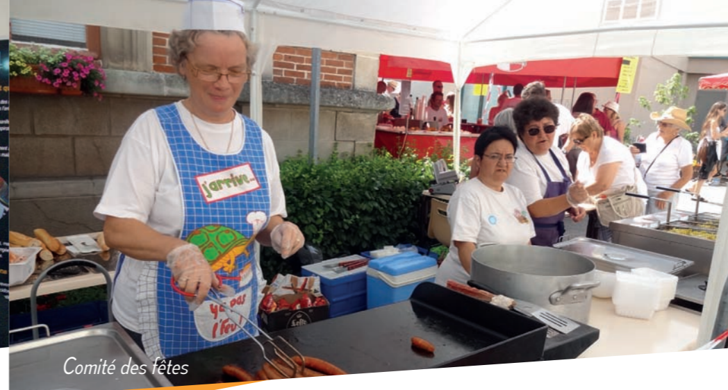
Comité des fêtes