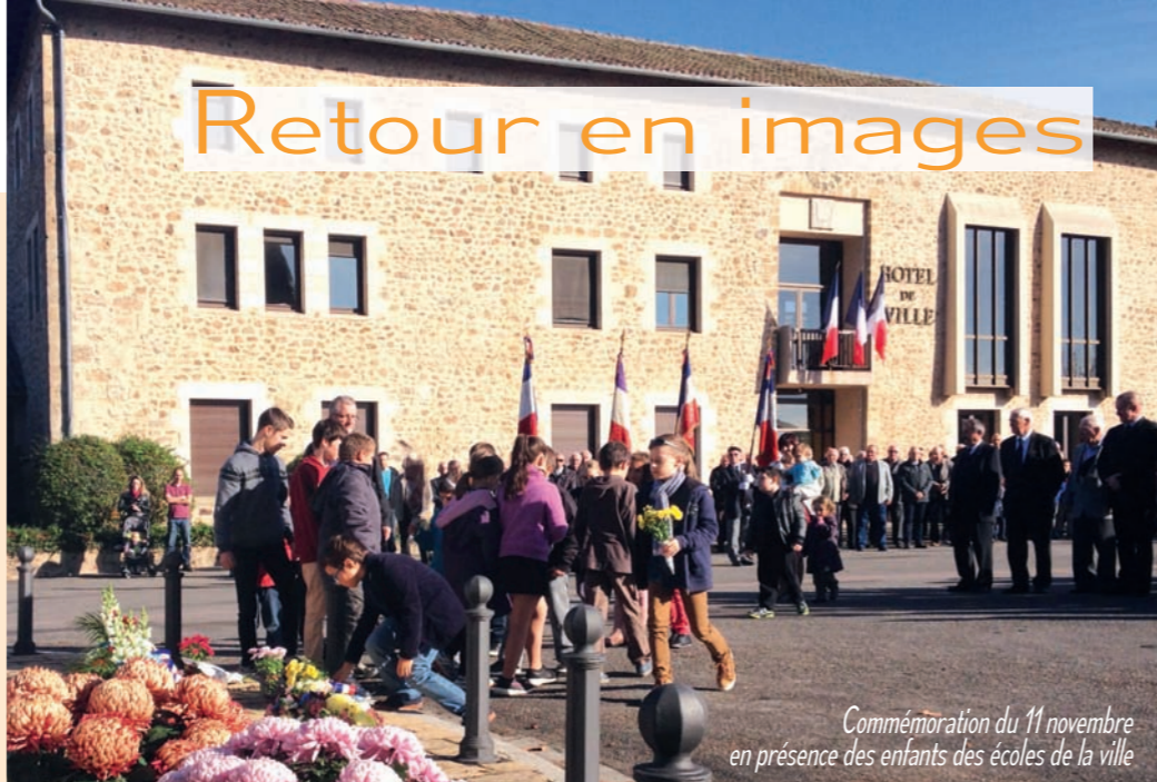
Commemoration du 11 novembre en présence des enfants des écoles de la ville