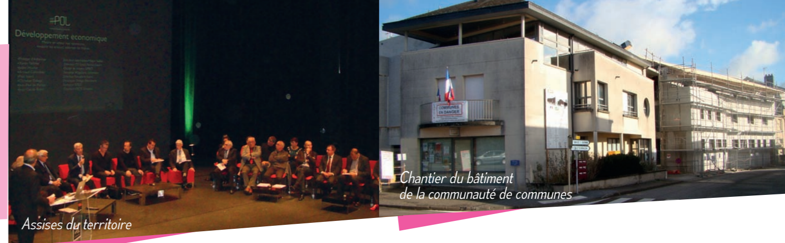
Assises du territoire

Cette compétence permettra également de mener des initiatives en matière de préservation, de promotion et d'animation des sites naturels remarquables. C'est dans ce cadre que « Porte Océane du Limousin », assumera la gestion de la