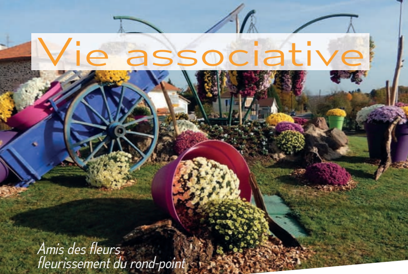
Amis des fleurs fleurrissement du rond-point