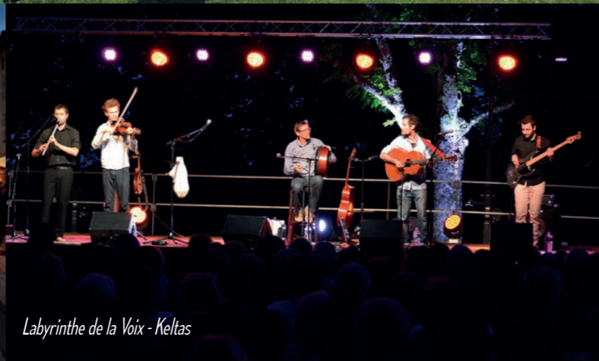
Labyrinthe de la Voix - Keltas