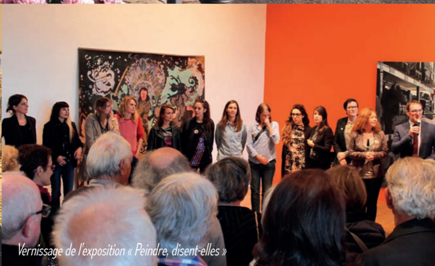
Vernissage de l'exposition « Peindre, disent-elles »