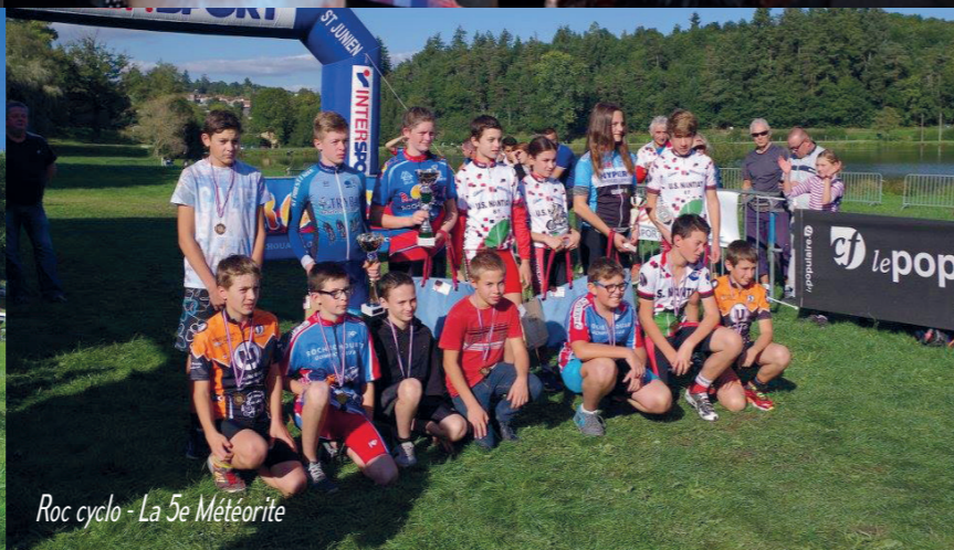
Roc cyclo - La 5e Météorite