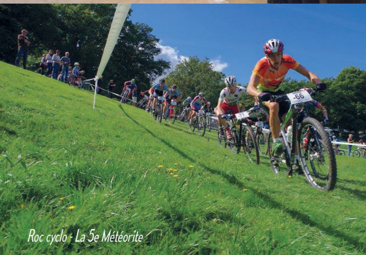
Roc cyclo - La 5e Météorite