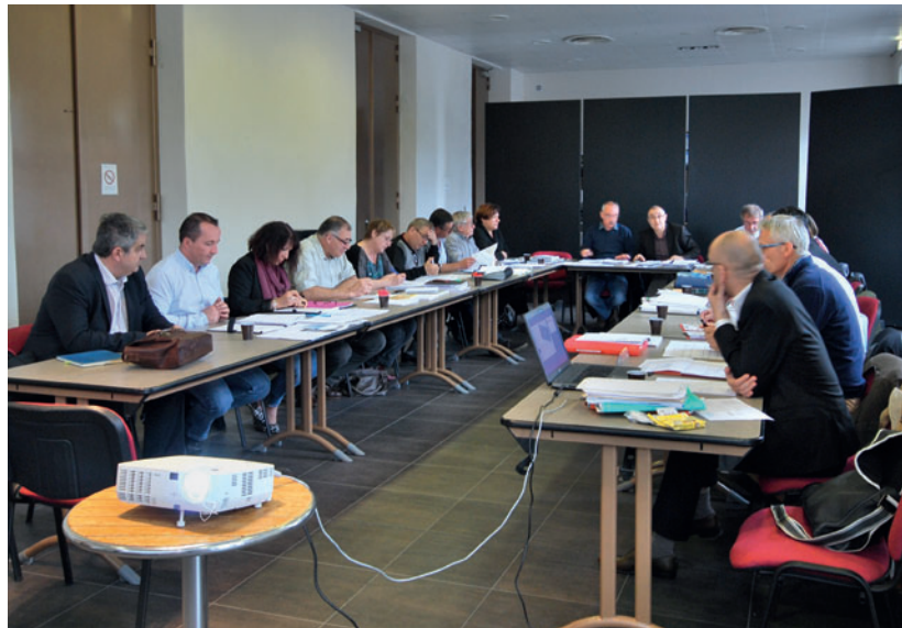
Nouveau territoire de l'intercommunalité