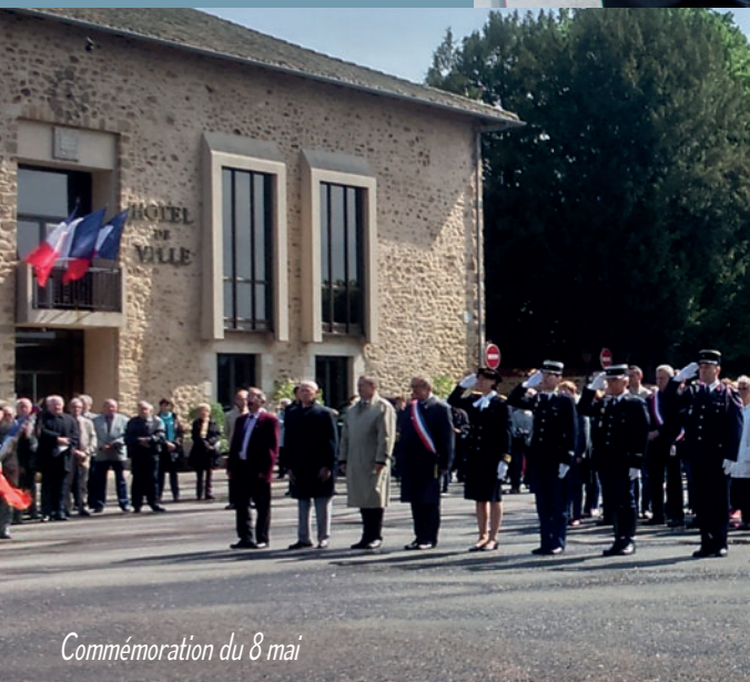
Commémoration du 8 mai