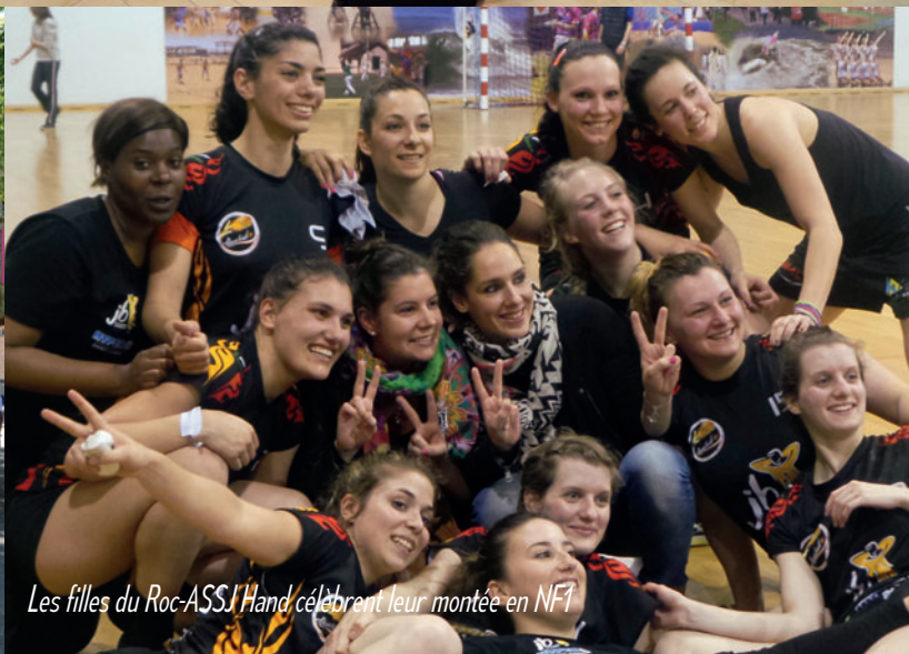
Les filles du Roc-ASSJ Hand célèbrent leur montée en N1