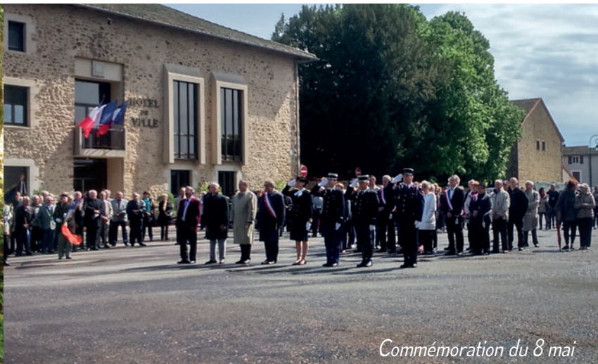
Commémoration du 8 mai