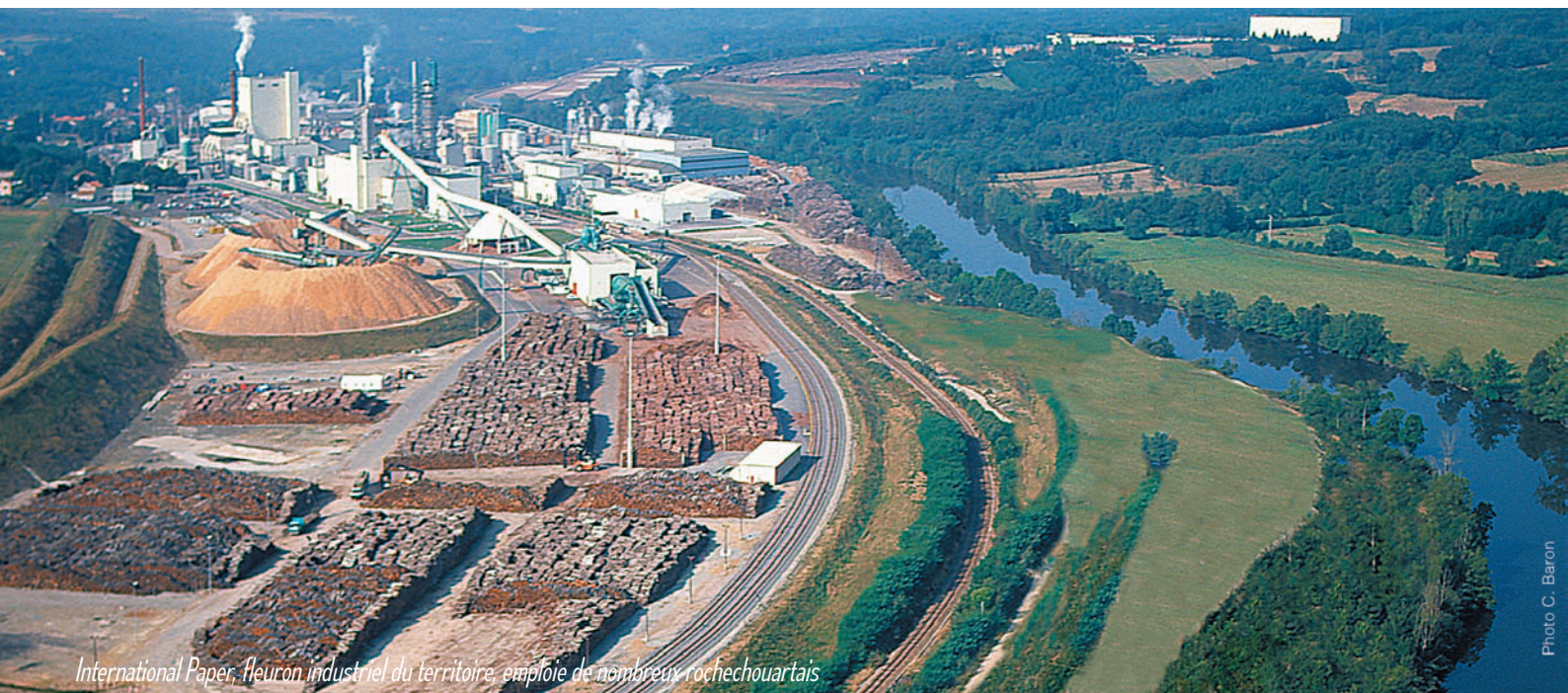
International Paper, fleuron industriel du territoire, emploie de nombreux rochechouartais