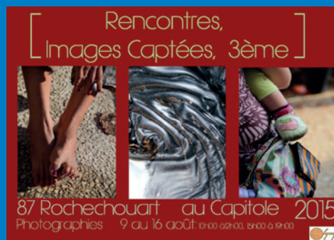
3 e édition de « Rencontres, images captées »

Plus que jamais, le Labyrinthe de la Voix, c'est un foisonnement d'événements et d'activités, d'amitiés et de découvertes... A découvrir sur leur site : http://www.labyrinthedelavoix.fr/