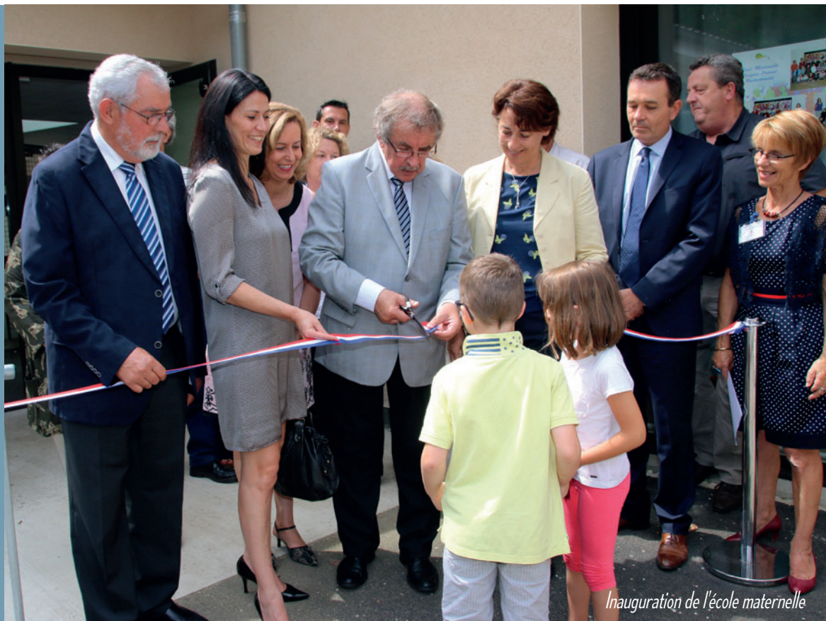
Inauguration de l'école maternelle

Retrouvez toutes les infos pratiques dans votre Guide Pratique ou sur www.rochechouart.com