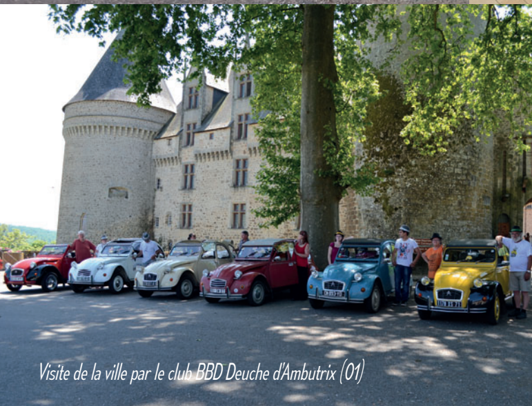
Visite de la ville par le club BBD Deuche d'Ambutrix (01)