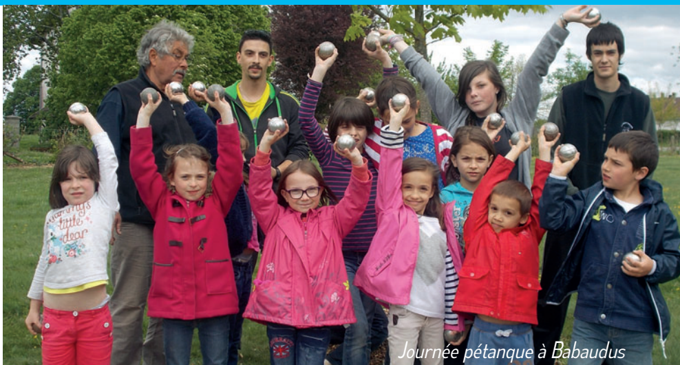
Journée pétanque à Babaudus

L'édition 2015 de ce rendez-vous traditionnel se déroulera un samedi à l'automne (la date reste à déterminer). Le thème de l'année a été fixé (au niveau national) : il s'agit de « La Nature ».