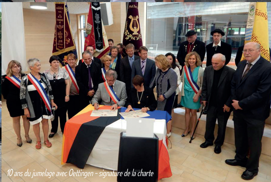
10 ans du jumelage avec Oettingen - signature de la charte