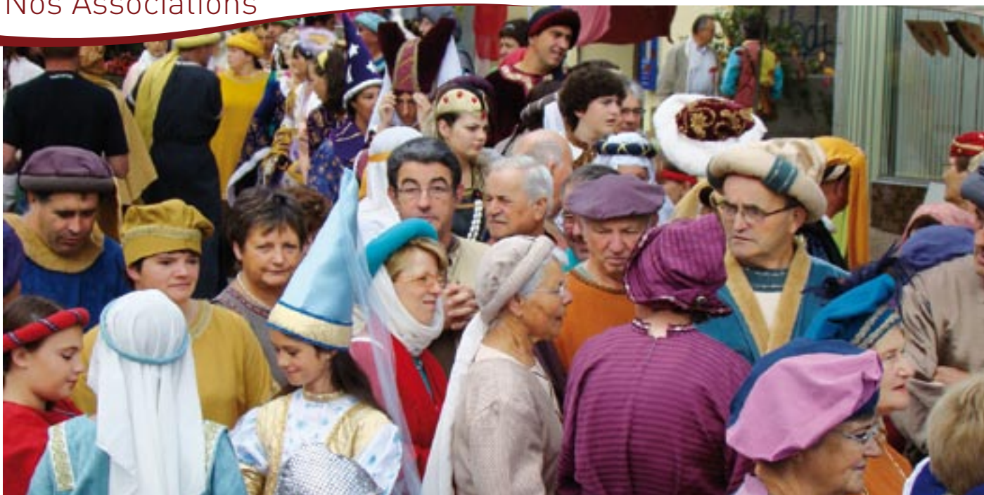
Fête médiévale du 14 août, organisée par l'ARCA