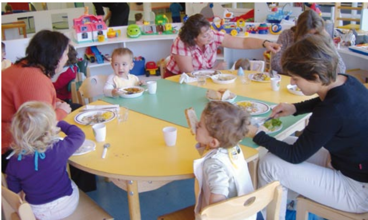
A l'occasion de la semaine du goût, le restaurant scolaire nous a concocté pour chaque jour un menu aux saveurs très différentes. Les papas et les mamans ont pu profiter de cette manifestation pour venir partager un repas avec leur enfant.

Ca y est, le Lieu d'Accueil Enfants Parents fait maintenant partie de la famille de l'Espace Anne Sylvestre.