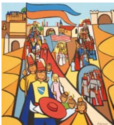
L'emblème des Ostensions, une peinture de Angel Contamine, qui a même été reproduite cette année sur des enveloppes de La Poste préimprimées.

3 spectacles, 2 expositions, 2 conférences, 2 veillées, une procession aux flambeaux... et, bien sûr, un grand défilé de clôture avec 30 groupes et 1 000 figurants costumés ! Les Ostensions 2009 de Rochechouart vont mettre les petits plats dans les grands pour cette manifestation septennale dont plusieurs temps forts nous invitent sur "les chemins de Saint Jacques de Compostelle".