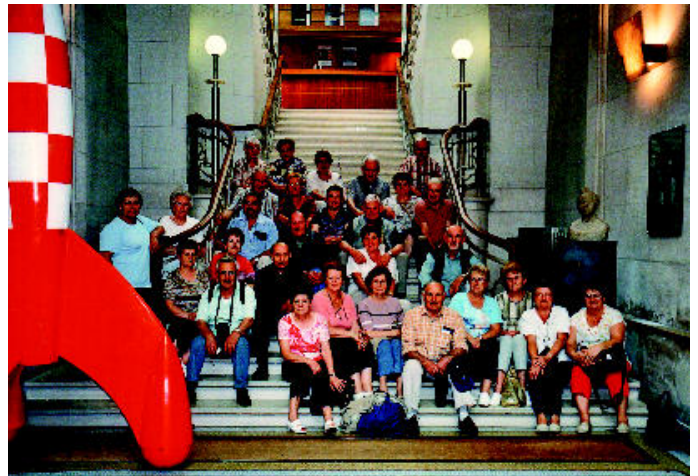
Le groupe en 2007 au musée de la BD de Tintin à Bruxelles.

Pour finir, une fois encore le comité des fêtes sera associé à l'ARCA pour présenter un spectacle le 24 décembre de la Compagnie Loupiote, suivi du traditionnel goûter.