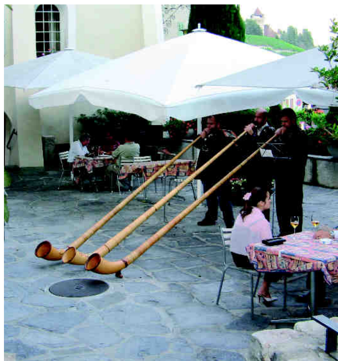
Consonances des Alpes

Nord pour habiter la Haute-Vienne où elle est enseignante. Spectacle rare, des musiciens suisses donneront un concert de cor des Alpes sur fond d'images commentées de leurs belles montagnes. La dernière soirée, le 14 août, verra comme de coutume l'embrassement du château, accompagné cette fois d'une bande sonore com-