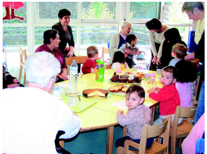
Des rencontres intergénérationnelles très fertiles

L'ancienne école de Babaudus n'en revient pas. Le portail refait à l'ancienne, un totem, des fresques cosmiques, un jardin avec des plantes qui ont résisté à l'impact de la météorite, un ancien ferronnier et des parents manches