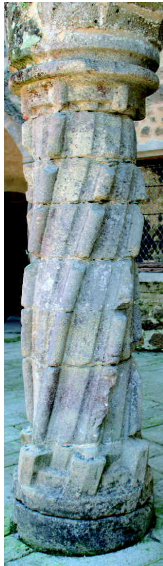
A gauche : Sans nom. Commande publique conjointe de l'Etat et du Département, 1985-1986.