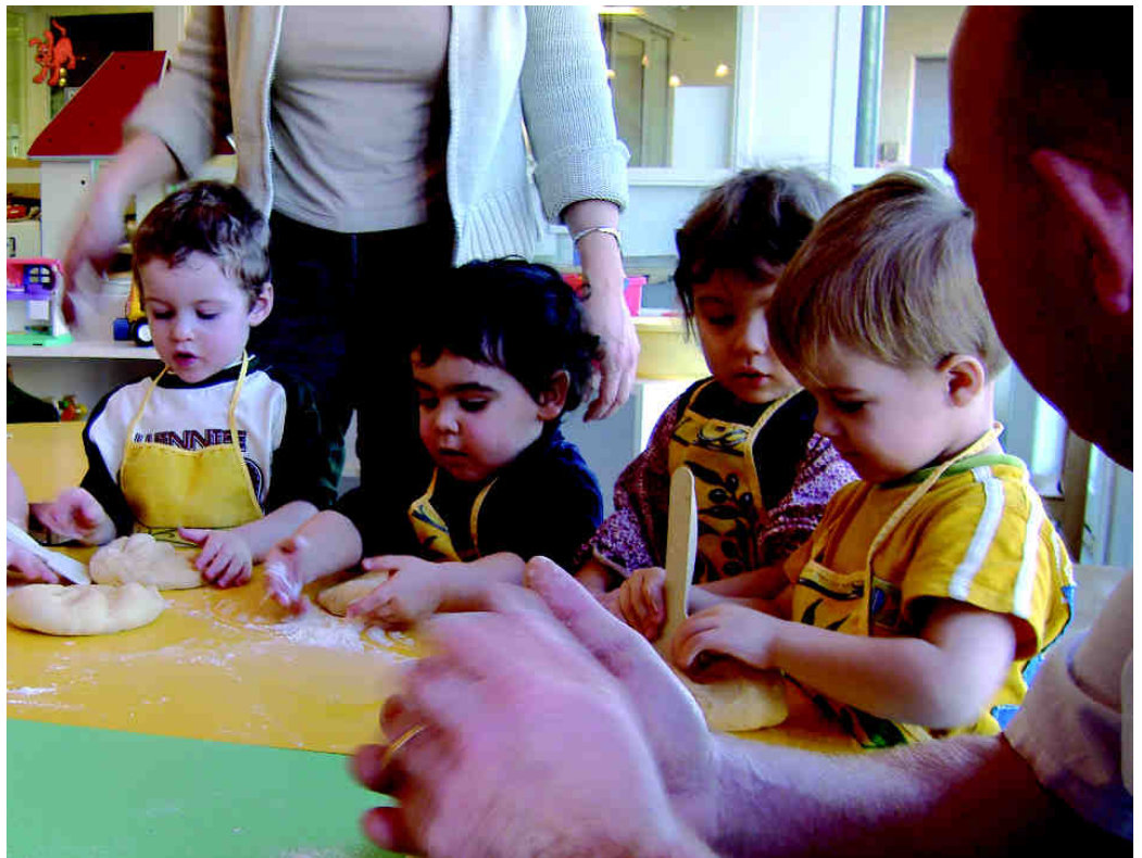
Atelier pâtisserie pour les tous-petits

Si le relais est totalement gratuit, le multi-accueil est payant, selon le revenu des parents. Ainsi, une demie journée, repas de midi compris, leur revient en moyenne à 4,76 €. Un prix qui est loin de refléter l'ensemble des coûts : le personnel, le fonctionnement, les soins, les repas, les jouets, etc. Mais c'est un choix volontaire d'assurer pas seulement un " service de garde " mais un lieu à forte dimension péda-