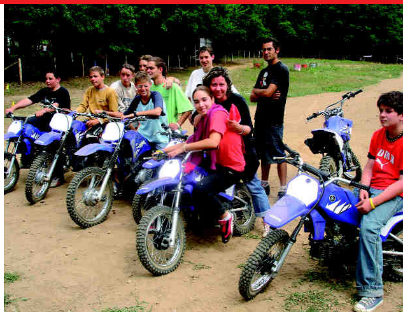
Foyer des jeunes - action prévention moto en 2005

Ce qui s'appellait " le foyer " accueille les jeunes de 13 à 18 ans dans son local en ville, à côté du gymnase. Le but recherché n'est évidemment pas la " garde ". A cet âge encore plus, sans contenu ni démarche spécifique et adaptée, on court à l'échec. La démarche retenue est celle de la conduite de projet. " Le travail de l'animateur, souligne Philippe Levanier, ce n'est pas que de proposer des loisirs ". Ainsi le dialogue et l'écoute permettent de détecter des idées, les jeunes rédigent eux-même leur projet, leurs fiches action, le budget. Puis c'est le passage devant la commission Jeunesse et les partenaires où le jeune présente lui-même son projet. Il en retire une certaine valorisation et cela crée du lien entre la jeunesse et ceux qui l'entourent. " On sort ainsi du tout loisirs, insiste Philippe, ce n'est plus du gratuit ni de la simple consommation ".