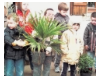
Le jardin exotique de Babaudus

Les activités "nature" et "sportives" sont aussi au programme, à la journée et sous forme de mini camps. Des ateliers variés permettront aux enfants de découvrir la vie en collectivité, mais aussi de se donner le temps de souffler, de rêver, d'expérimenter et de se ressourcer. La percussion et la danse vont également rythmer les séjours.