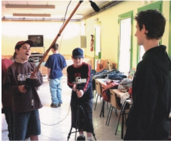
"Séance de tournage par les ados" : pour présenter la région de Rochechouart aux habitants de la ville jumelée d'Oettingen

Il semble bien que la formule plaise. Depuis les vacances de février, 27 jeunes ont pris la carte du foyer ; une dizaine d'autres sont en cours d'inscription. La fréquentation moyenne est d'une vingtaine de jeunes au local le mercredi. Une belle réussite, en peu de temps.