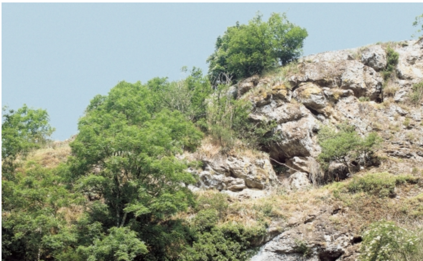
Témoignage de l'impact météoritique : l'affleurement de brèche derrière le Château

Le dossier du Centre de la météorite évolue pas à pas, avec à présent des avancées décisives. On en est pour l'heure à l'étude de pré-programmation. Elle précise le contenu du projet qui a beaucoup avancé, si on se souvient des origines. C'est en 1967-1969 qu'on apprend l'origine réelle des