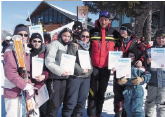
Au centre : Lecture à Babaudus Ci-dessus : séjour de ski en février 2005 (remise de diplôme).